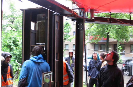
beelden: City Mine(d)