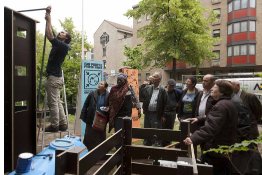
beelden: © Jo Voets