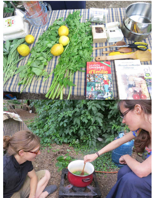
beelden: City Mine(d)