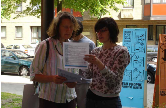
beelden: Conseil en Rénovation - Etterbeek